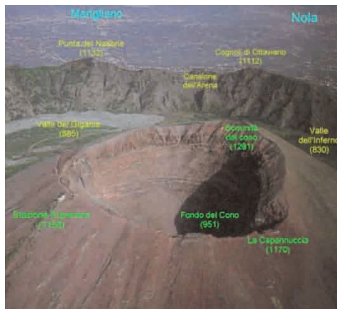
La complessa orografia del cratere vesuviano.

«Il dibattito principale nello sviluppo del piano di evacuazione nasce dalle opinioni contrastanti riguardo le circostanze per cui dovrebbe essere attivato e le azioni che il piano dovrebbe comportare. Alcuni sostengono che il piano dovrebbe fare fronte al solo scenario catastrofico, mentre altri propongono per un piano più flessibile, capace di fornire soluzioni differenti sulla base della portata dell'evacuazione», afferma Gasparini.