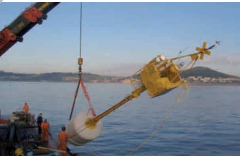
Dal 2008 funziona nel Golfo di Pozzuoli la prima stazione sommersa, connessa in tempo reale con l'Osservatorio vesuviano.

ed accelerometri (solitamente utilizzati nell'urbanistica) per misurare gli spostamenti del terreno. La sensibilità di questi dispositivi alle alte frequenze permette ai ricercatori di individuare anche i sismi più deboli, fino ad arrivare a quelli con magnitudo negativa.