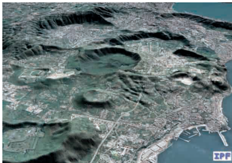
L'area dei Campi Flegrei, di evidente origine vulcanica.

L'ultima grande eruzione del Vesuvio risale al 1944, solo qualche decennio fa. In effetti, salendo per il sentiero scavato nella lava, che conduce all'orlo del cratere principale, a 1.281 metri di altitudine, si